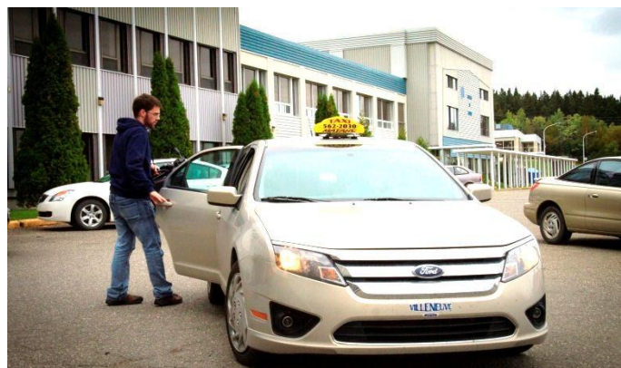
Navette-taxi cégep/centre-ville 13 354 $

La Fondation contribue à des projets communautaires qui ont un impact sur la qualité de la formation, le maintien des programmes d'études et le développement du cégep.