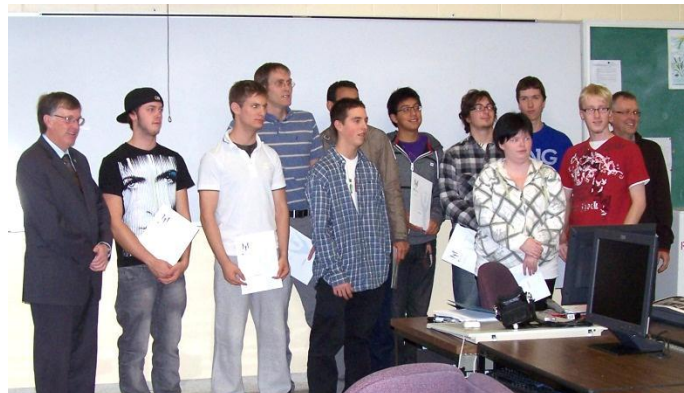
Techniques d'aménagement et d'urbanisme 5 000 $

Les bourses d'études dans un programme désigné favorisent l'attrait de candidatures au sein d'un programme nouveau ou en relance.