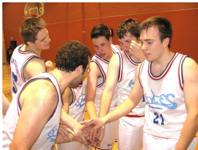
Sport intercollégial Éoles 5 000 $